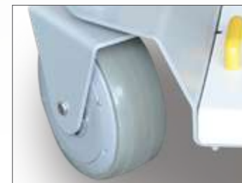
Vue sur roue autonome avec batterie intégrée.

Charge de fonctionnement en sécurité : 320 kg