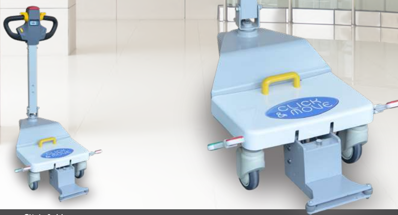
Click & Move Tracteur motorisé par roue autonome