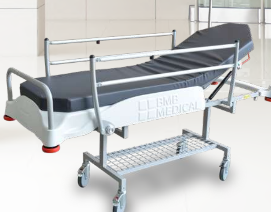
PRELE Chariot brancard à hauteur fixe