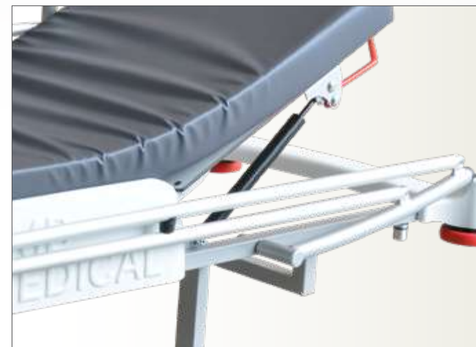
Détail Relève buste par vérin gaz

Charge de Fonctionnement en sécurité : 250 kg. Poids maxi patient : 185 kg.