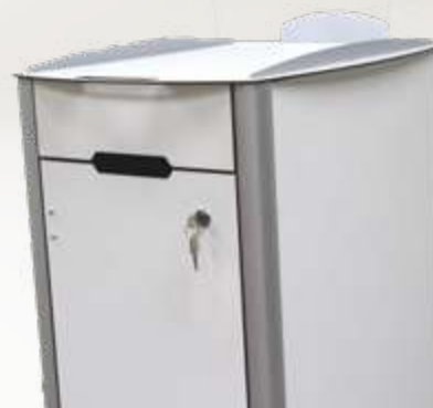
Chevet / Vestiaire bac à chaussures inclus