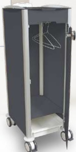
Chevet / Vestiaire penderie incluse