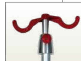
Réf TSR2 Tige porte sérum amovible en 2 parties, 2 crochets