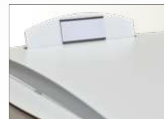
Identification patient / fauteuil / chevet