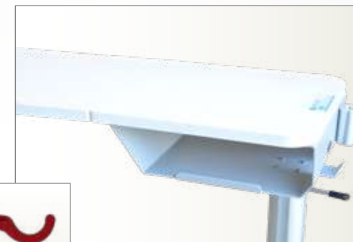
Stockage sous plateau