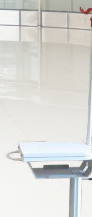
Assistant Hauteur variable assisté par vérin à gaz. Tablette repliable