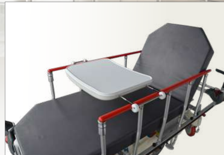
Plateau Repas Universel sur brancard I-CARE