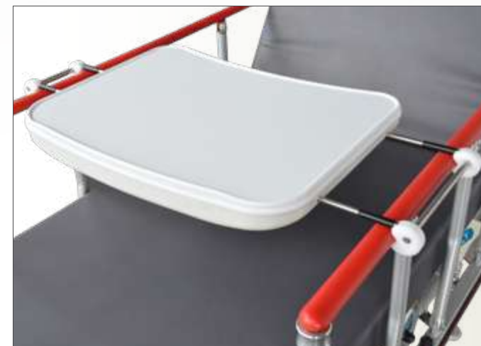
Plateau repas universel Adaptable à toutes les largeurs de couchage