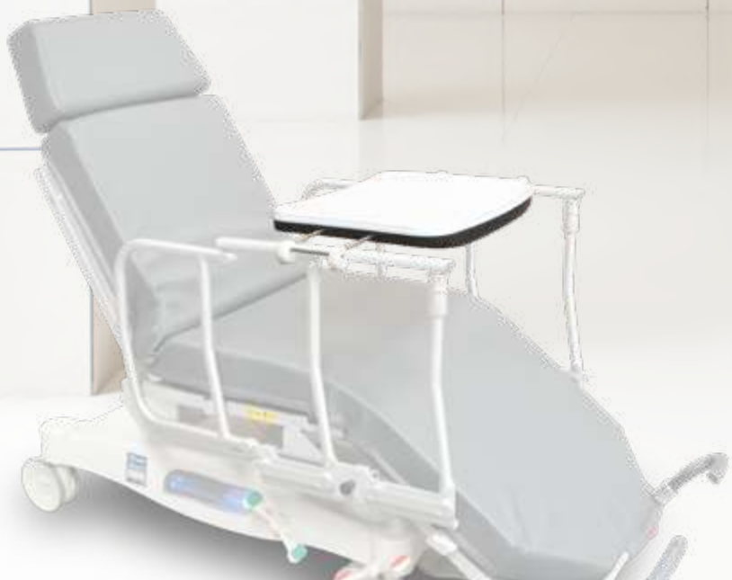
Plateau Repas Universel sur CLAVIA LSA CHIR