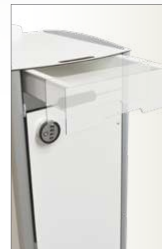
Chevet/ Vestiaire avec tiroir pour stockage des effets personnels du patient