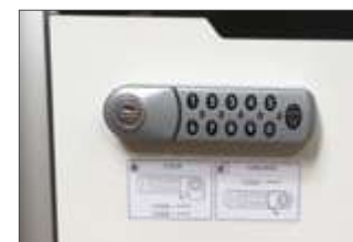
Système de verrouillage digital tiroir et porte (en option)