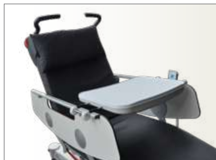
Plateau Repas Universel sur CLAVIA LSA à barrières pleines

Charge de fonctionnement en sécurité : 10Kg.