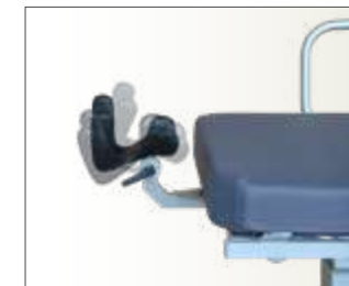
Tête Stomatologique multi-positions et amovible (en option)