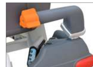
Détail poignée rotative avec accélération progressive.