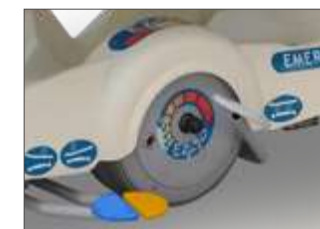
Détail roue motorisée autonome.