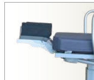
Tête Ophtalmologique multi-positions et amovible (en option)