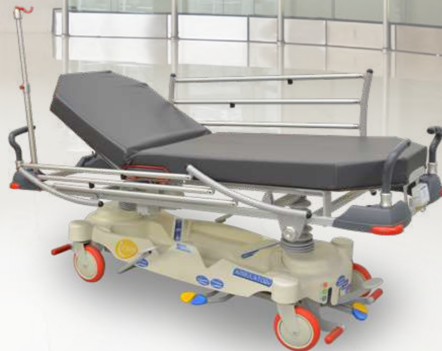
I-CARE Ambulatory 60 / Ambulatory 70 / Ambulatory 80 Chariot brancard à hauteur variable hydraulique