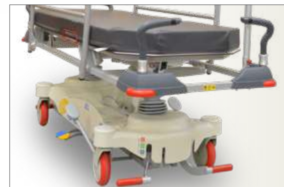
Détail barres de poussée escamotables