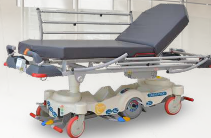
I-CARE EZ-GO Ambulatory 60 / Ambulatory 70 / Ambulatory 80 Chariot brancard motorisé à hauteur variable hydraulique