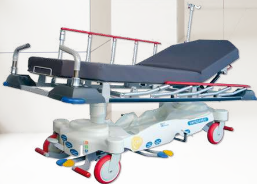
I-CARE Emergency 60 / Emergency 70 Chariot brancard à hauteur variable hydraulique