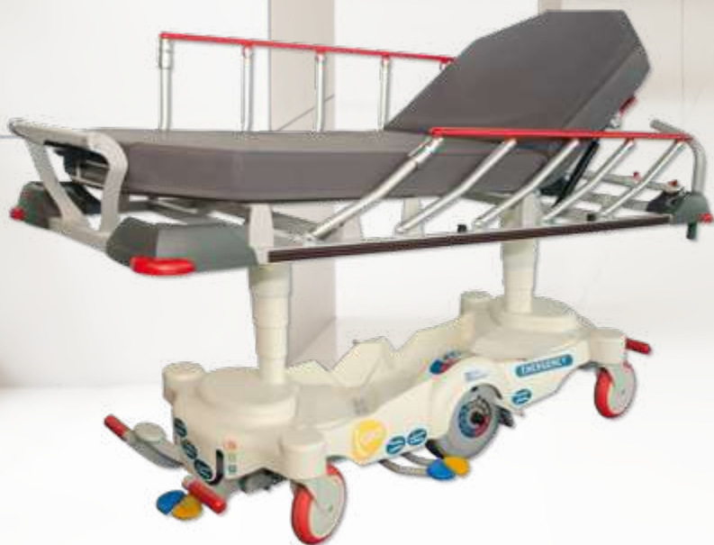
I-CARE EZ-GO Emergency 60 / Emergency 70 Chariot brancard motorisé à hauteur variable hydraulique