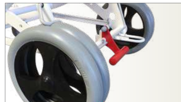
Détail roues arrières jumelées Ø 300 avec frein centralisé