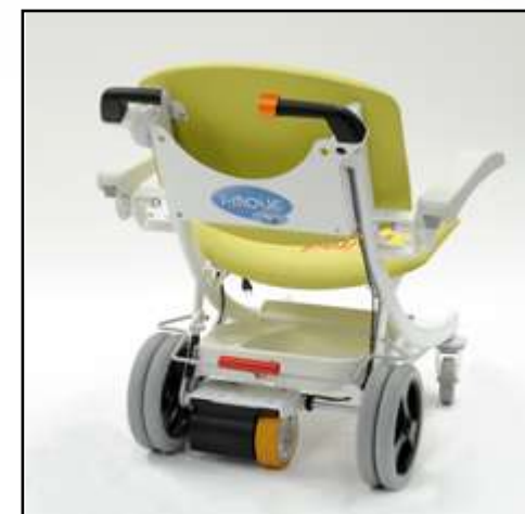
Roue motorisée avec batterie et chargeur intégrés.

Charge de Fonctionnement en sécurité : 200 kg.