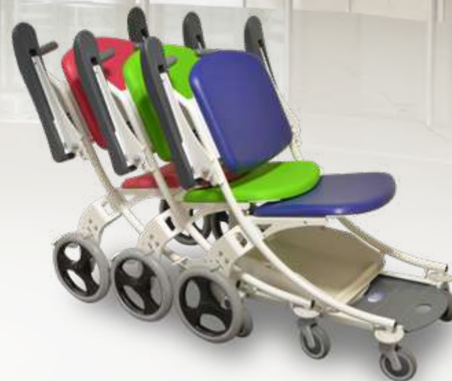
Chaises de transfert I-Move encastrées permettant un rangement optimisé