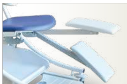
Repose jambes deux positions (en option)