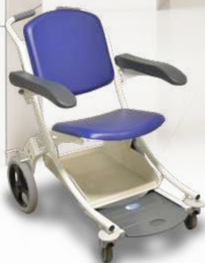
Chaise de transfert I-MOVE permettant l'accueil des patients