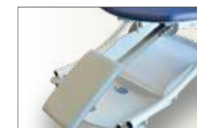
Réf TRORJ Repose jambes réglable