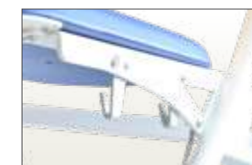
Réf PSU Crochets porte sac