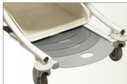
Détail repose-pieds coulissant

Charge de Fonctionnement en sécurité : 250 kg.