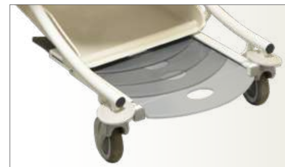
Détail repose-pieds coulissant

Charge de Fonctionnement en sécurité : 200 kg.