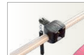
Réf TROMO Monnayeur